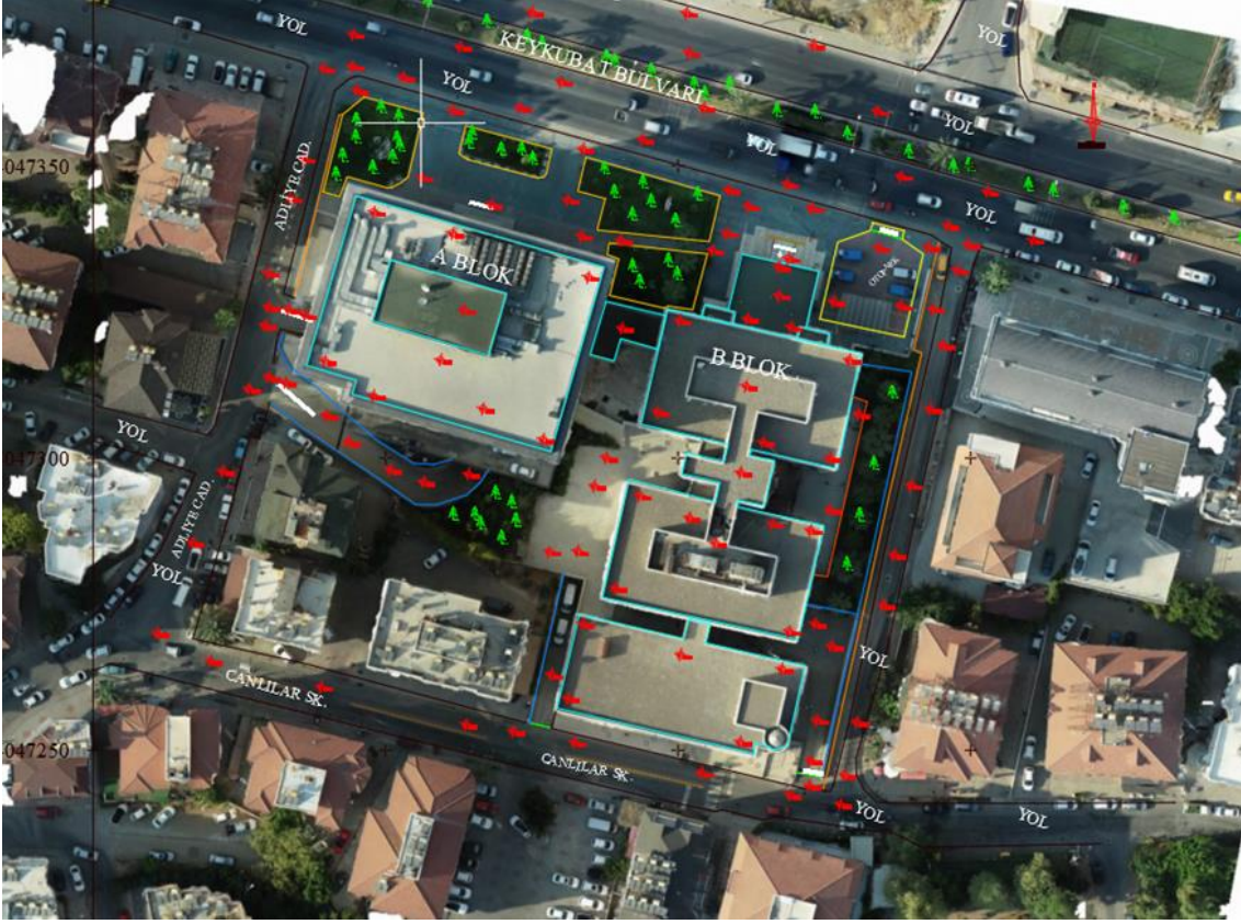
Şekil 3. Vaziyet Planı