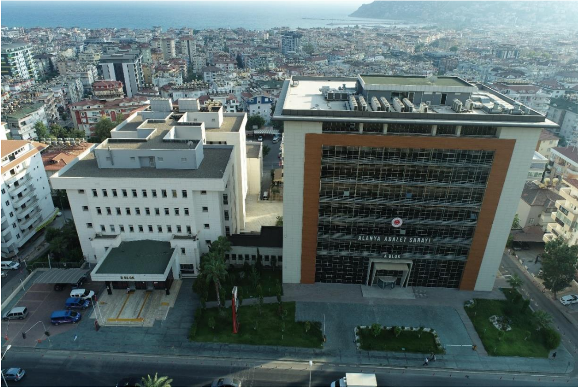
Şekil 4. Alanya Adalet Sarayı Genel Görünüm