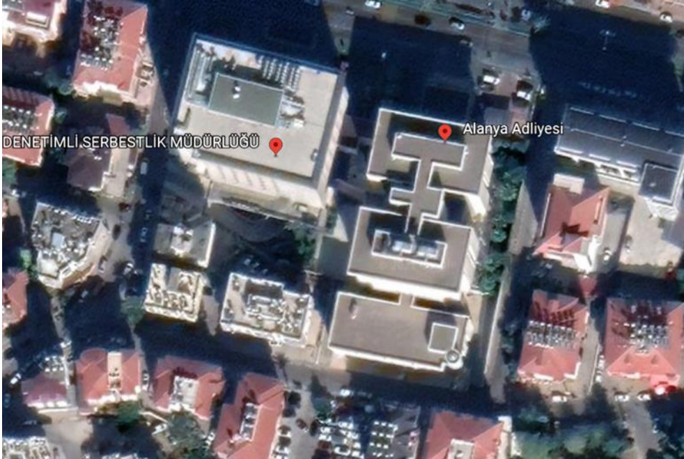
Şekil 2. Alanya Adliyesi Uydu Görüntüsü