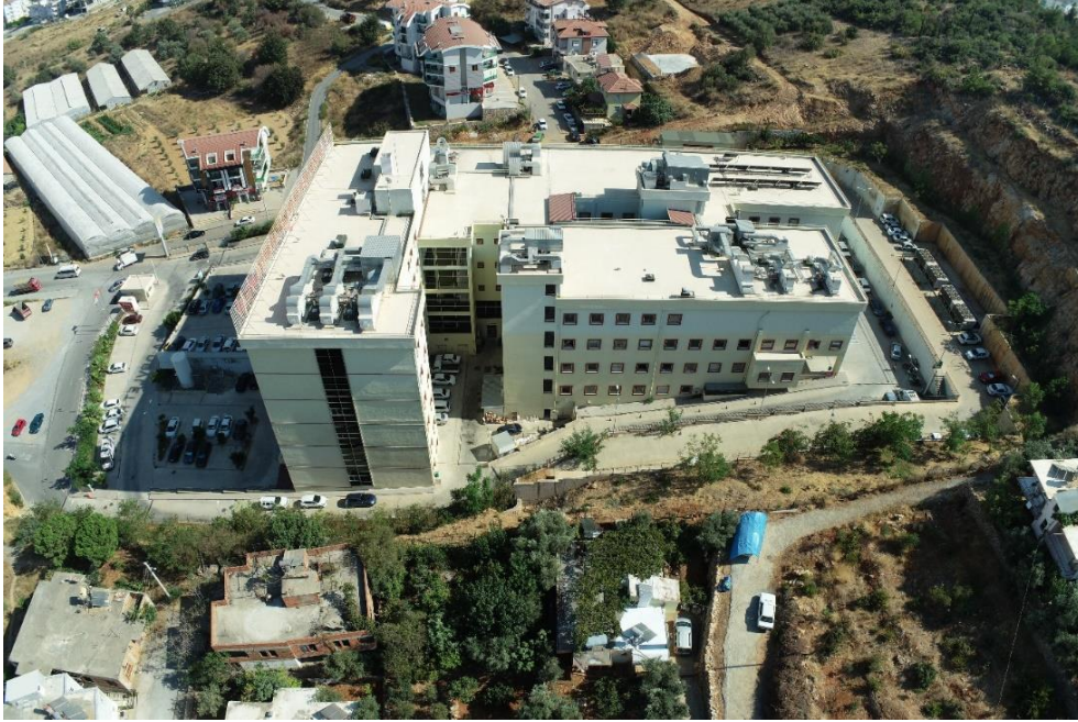
Şekil 4. Gazipaşa Devlet Hastanesi Genel Görünümü