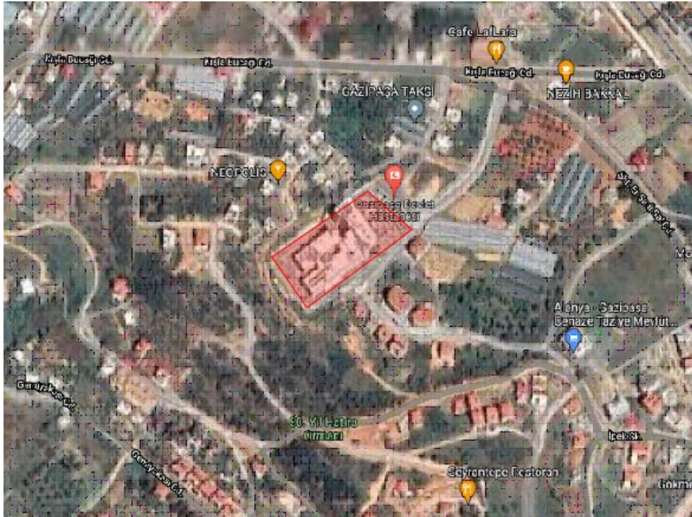
Şekil 2. Gazipaşa Devlet Hastanesi Uydu Görüntüsü-1