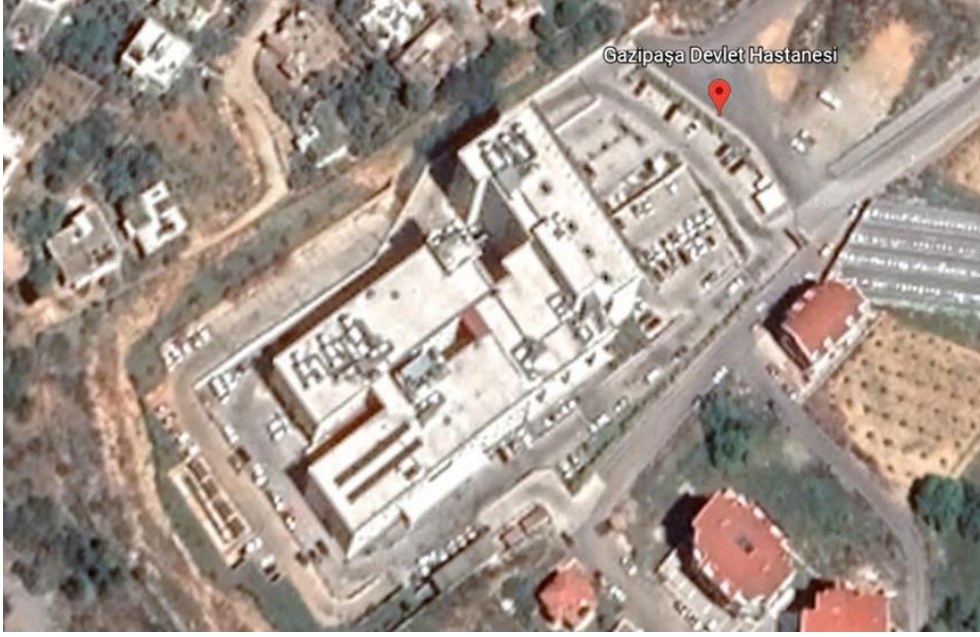
Şekil 3. Gazipaşa Devlet Hastanesi Uydu Görüntüsü-2